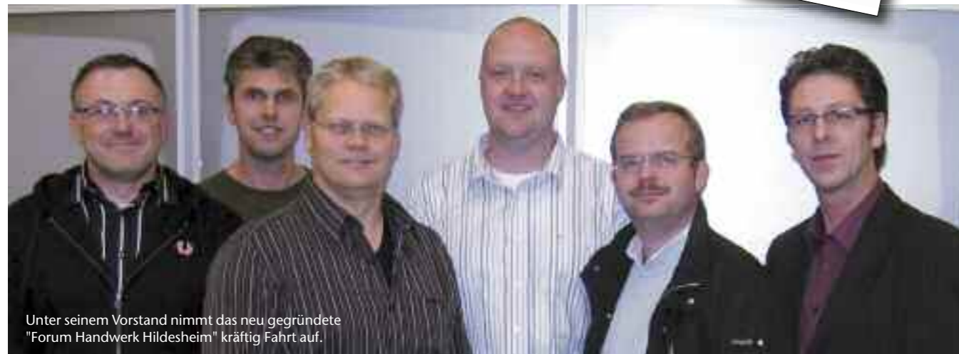
Unter seinem Vorstand nimmt das neu gegründete "Forum Handwerk Hildesheim" kräftig Fahrt auf.

Neuer Name, neue Organisationsstruktur, den Blick auf die Zukunft gerichtet – kürzlich wurde aus den Junioren des Handwerks Hildesheim das Forum Handwerk Hildesheim. Dabei handelt es sich nicht um eine bloße Umbenennung, sondern es steckt ein handfester Grund hinter diesem Schritt: Die bisherige Altersstruktur der Handwerksjunioren schloss die über 40-Jährigen von Stimmrecht und der Übernahme von Ämtern aus. Diese Beschränkung ist nun aufgehoben und das ermöglicht ein dauerhaftes ehrenamtliches Engagement – ein wichtiges Signal für die Zukunft. Bereits im letzten Jahr wurde ein Arbeitskreis ins Leben gerufen um die Neustrukturierung des Vereins auszuarbeiten.