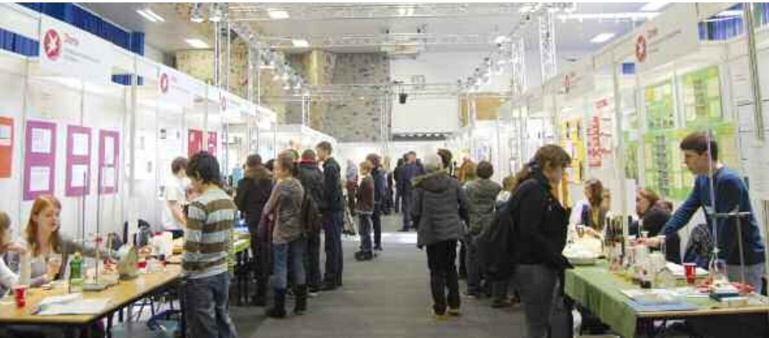
Geballter Forscherdrang: In der Sporthalle der Uni wurden an drei Tagen 95 Projekte ausgestellt und von der Jury bewertet.