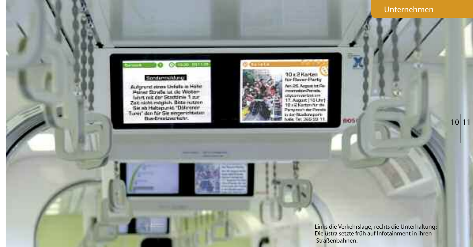
Links die Verkehrslage, rechts die Unterhaltung: Die üstra setzte früh auf Infotainment in ihren Straßenbahnen.

Inova Multimedia GmbH sorgt weltweit für Infotainment